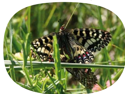
Accouplement de diances

D'autres espèces à forte valeur patrimoniale et bénéficiant d'une protection (annexe IV de la directive « Habitats », protection nationale ou régionale) sont signalées sur le site comme, par exemple, le papillon « diane ».