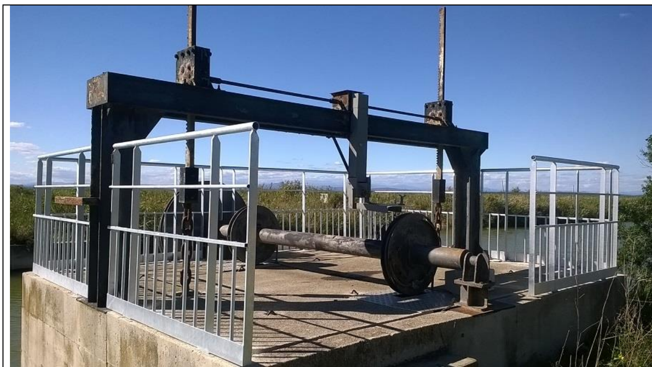
Nouveau garde-corps sur le barrage-anti-sel du canal de Lunel

En septembre 2015, des travaux de sécurisation du barrage anti-sel sur le canal de Lunel ont été réalisés. Ils ont permis de mettre aux normes le garde-corps et de sécuriser l'accès à l'ouvrage pour un montant total de : 6 906 € TTC