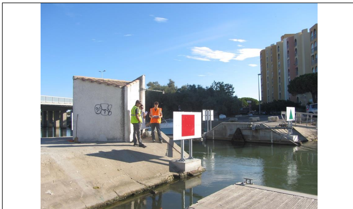
Les nouveaux panneaux de signalisation maritime