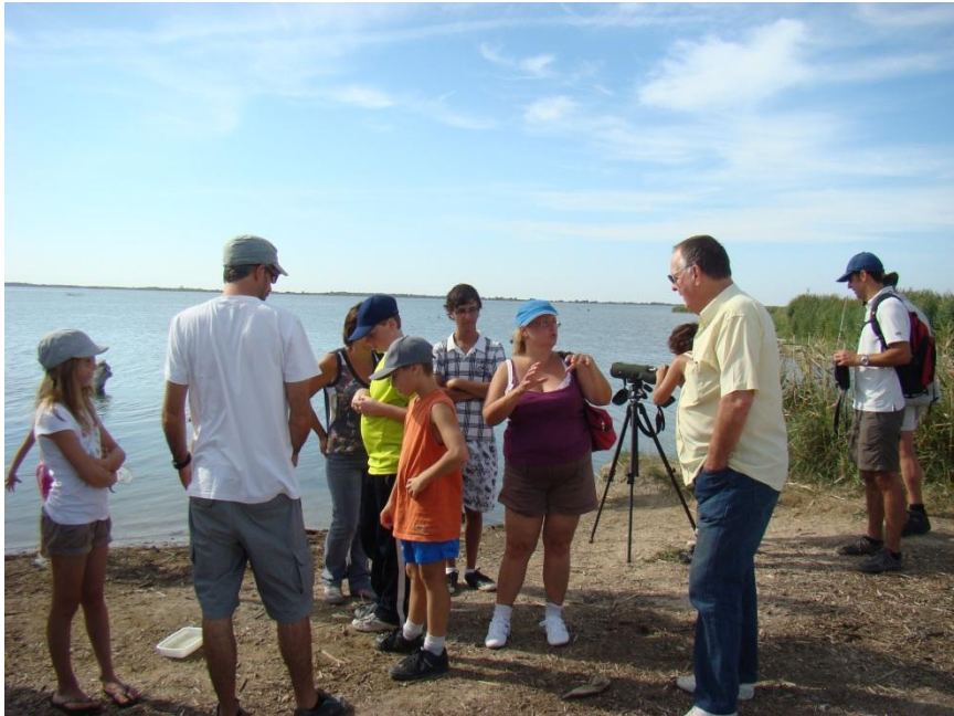
Une sortie sur l'étang de l'Or

Au total, 159 personnes ont participé à ces ballades naturalistes soit une moyenne de 19.8 personnes par sortie. A noter que ces ballades permettent à des locaux (20% des participants) de venir découvrir ce secteur de l'étang.