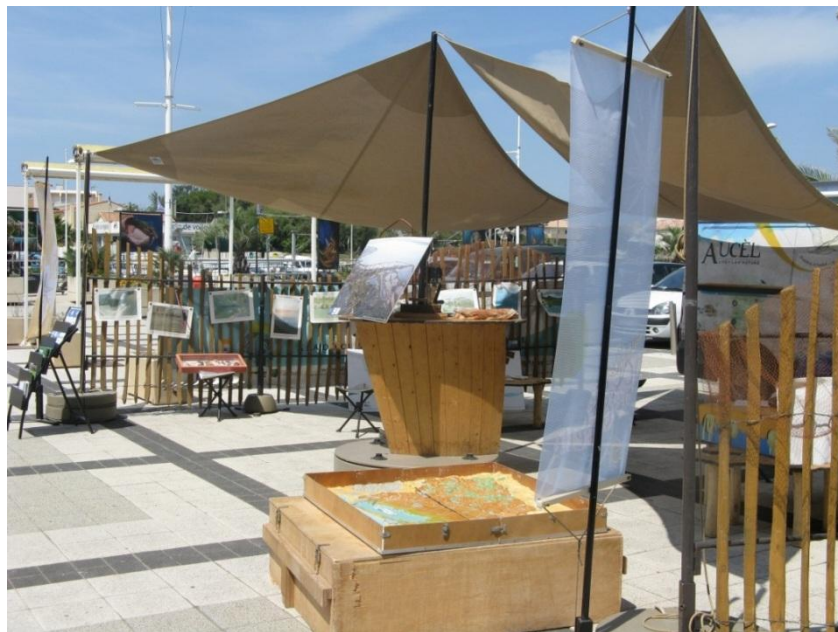
L'AUCEL à Carnon

Un volet important du programme life+ LAG NATURE concerne l'éducation à l'environnement. Ainsi, un véhicule itinérant dénommé « AUCEL » a vu le jour au printemps 2010. Ce véhicule composé d'outils pédagogiques doit aller à la rencontre du public sur les 5 sites et structures concernés par le programme life+.