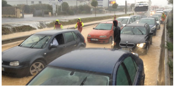
Inondations du 29 septembre 2014_Route-de-Fréjorgues