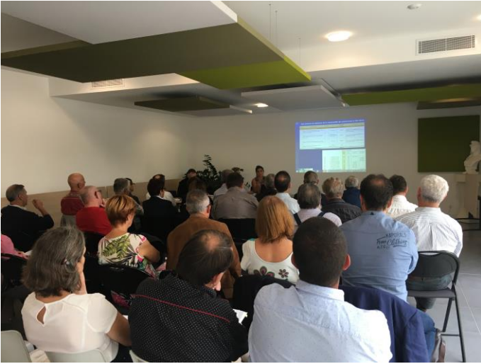
COPIL PAPI du 14/09/2017 à Candillargues @Symbo