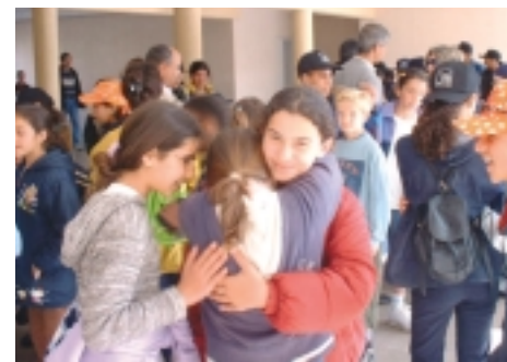
Retrouvailles des enfants

50 scolaires et 20 socioprofessionnels représentants la Merja Zerga ont pu consolider et accentuer les premiers échanges réalisés en 2001.