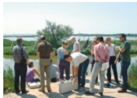
Le FOGEM à Mauguio

Ils se réunissent périodiquement sur le terrain: le 22 juin 2002, ils se retrouvaient à Mauguio.