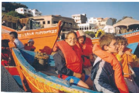
Départ pour la visite de Merja Zerga

Dans le cadre de l'échange pédagogique, deux classes de Cm1 des écoles de Marsillargues et de Saint Just ont pu découvrir et apprécier les richesses, les activités, les traditions et les coutumes liées à cette lagune marocaine semblable à l'étang de l'Or. Comme lors des précédents échanges, l'accueil des marocains restera inoubliable.