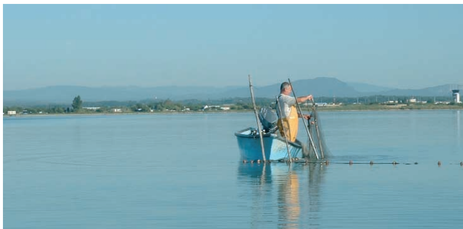
Pêcheur sur l'étang