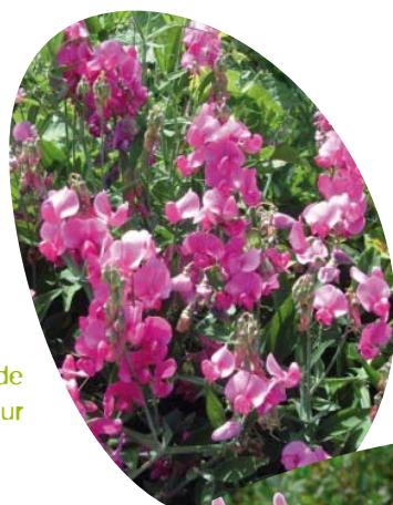
Pois de senteur