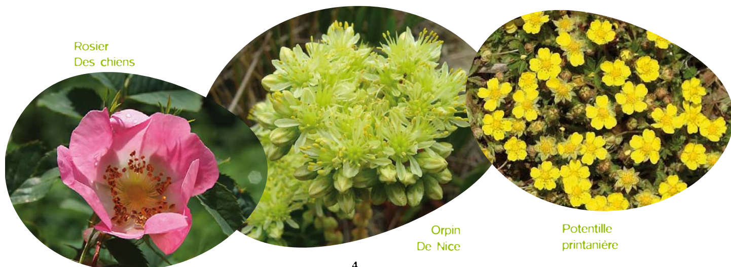
Rosier Des chiens