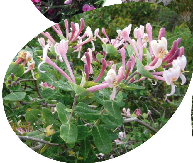
Chèvrefeuille des Baléares