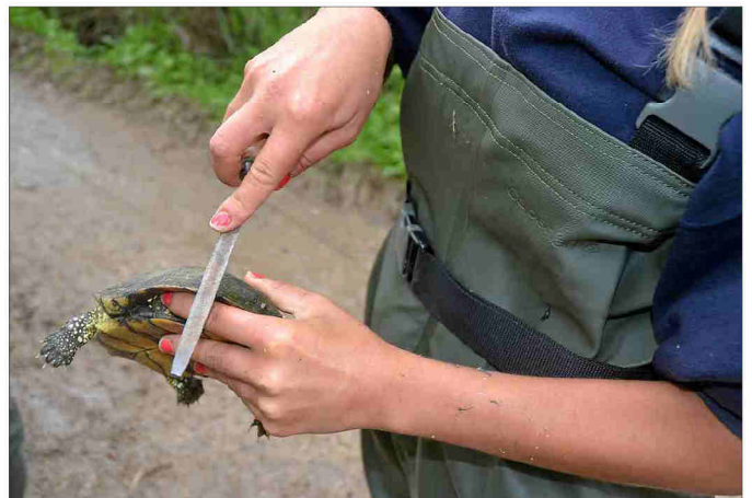
■ Avant d'être relâchées, les tortues Cistude sont mesurées à l'aide d'un pied à coulisses puis leurs carapaces sont légèrement limées afin de les reconnaître.