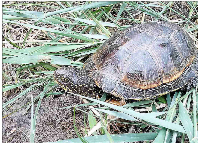
■ La Cistude vit dans les zones humides aux eaux douces, calmes et ensoleillées.

Si tel n'est pas le cas, la tortue a droit à une petite photo. Mais, avant de retrouver les plaisirs de la liberté, sa carapace est limée à un endroit très précis, afin de savoir si elles ont déjà été répertoriées : « Cela nous