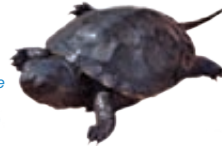
Cistude d'Europe jeune individu

Les agriculteurs sélectionnent dans le DOCOB les mesures qu'ils souhaitent mettre en œuvre, sur les parcelles de leur choix. Leur engagement porte sur la mise en œuvre d'un plan de gestion pastorale, la rouverture de milieux ouverts fortement embroussaillés ou encore sur des mesures de retard de fauche, de réduction de la fertilisation et de création de bandes enherbées favorables à la faune.