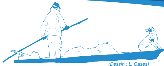
(Dessin : L. Cases)