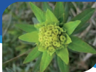
Euphorbe des marais