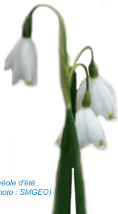
Nivéole d'été