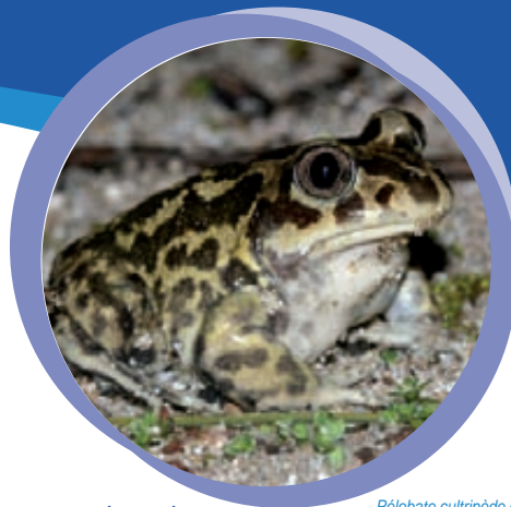
Pélobate cultripède dans les milieux dunaires du Grand Travers

Le programme de mesures vise à concilier les pratiques humaines et le maintien des habitats naturels et des espèces, à restaurer et/ou entretenir des milieux naturels, ou ouvrages nécessaires à leur bon fonctionnement écologique, et à poursuivre la sensibilisation du public au patrimoine écologique exceptionnel de l'étang de l'Or et de ses marges.