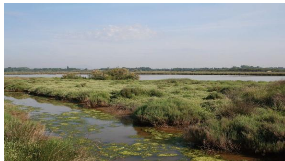
Etang de l'Or - Source Symbo

Ci-contre : Photos prises par Eric MARTIN - Source Symbo De haut en bas : Le Bérange, Candillargues, Palavas, Le Salaison