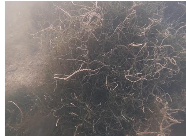
Station Bastit : Algue Chaetomorpha Transparence de l'eau jusqu'au fond