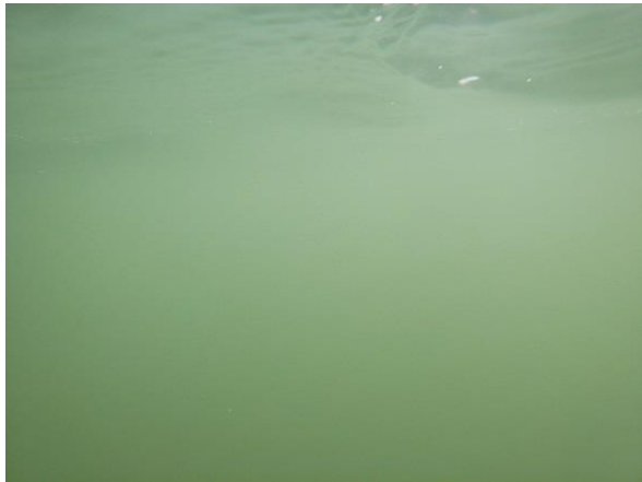
Station Grand Travers : couleur et relative transparence de l'eau