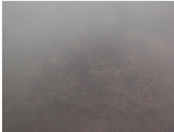
Station Carnon : présence d'un herbier (peut-être Ruppia cirrhosa)